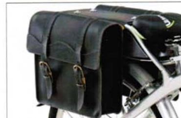
ACCESSORI OPZIONALI E DETTAGLI PRODOTTO