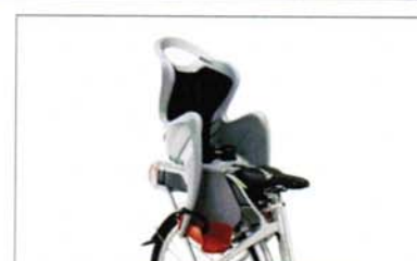
ACCESSORI OPZIONALI E DETTAGLI PRODOTTO