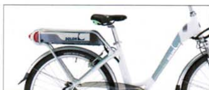
Carta da zucchero-bianco