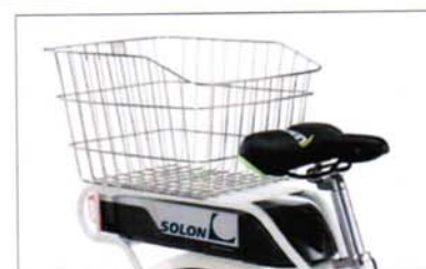
ACCESSORI OPZIONALI E DETTAGLI PRODOTTO