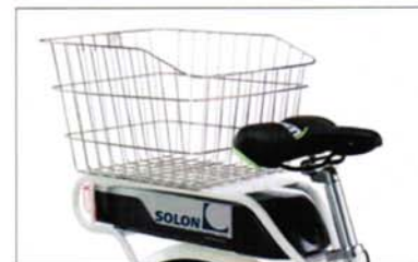
ACCESSORI OPZIONALI E DETTAGLI PRODOTTO