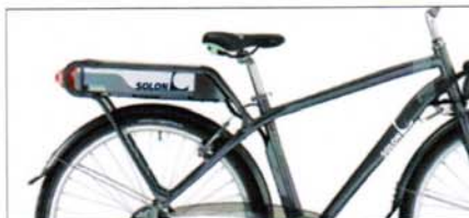
Antracite 28" Antracite 26"