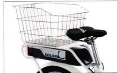
ACCESSORI OPZIONALI E DETTAGLI PRODOTTO