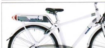
Bianco 28" Bianco 26"